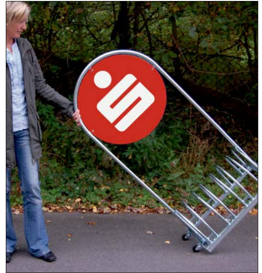
Praktisch leicht zu bewegen. Light an easily transportable.

Der formschöne Werbeträger für die dauerhafte Folienbeschriftung. Zweiseitig beschriftbar. Werbewirksam eingesetzt in Fußgängerzonen, vor Ladenlokalen und in der Gastronomie. Bietet Einstellmöglichkeit für bis zu vier Fahrräder.